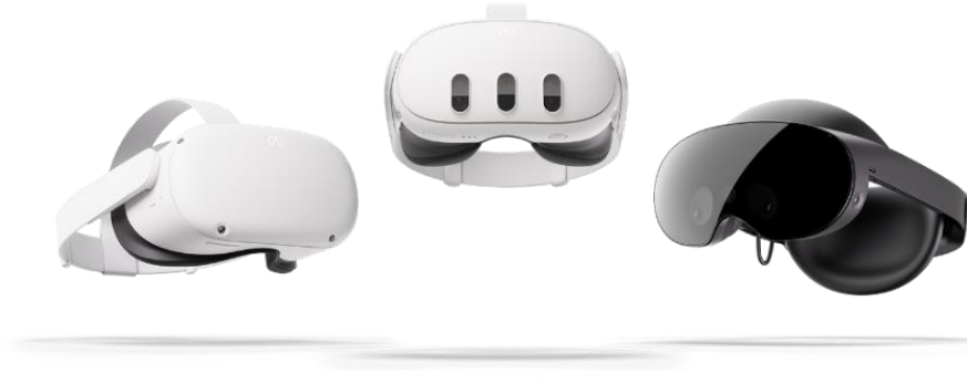
صورة رقم (3) نظارات Meta Quest.

وبشكل عام فكل ما يحتاجه الفرد هو ارتداء الأدوات الخاصة بتلك التقنية واختيار الشبيه الافتراضي له "Avatar" ليصبح مُمثلًا في هذا العالم الجديد، ويمكنه حينها التنقل بين تلك العوالم الافتراضية التي أنشأتها مختلف الشركات، عندئذٍ ستنمحو تجربة الميتافيرس حول القدرة المذهلة على الانتقال الفوري من عالم إلى آخر (الصاوي، 2022). أنتجت شركة ميتا نظارات الواقع الافتراضي Meta Quest والتي تسمح بالولوج إلى هذا العالم.